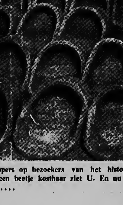
In Berlijn wachten rijen viltten slippers van bezoekers van het historische Humboldt-kasteel. De vloeren zijn een beetje kostbaar ziet U. En nu allemaal de pamoffelheld uitnodigen...